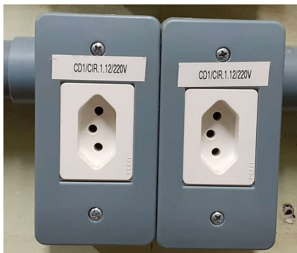
Figura 1 - Exemplo de identificação de tomada.

Todas as tomadas devem ter a identificação do circuito ao qual pertencem através de etiquetas adesivas. Um exemplo de identificação de tomada pode ser visto na Figura 1, onde está identificado o quadro de distribuição, o circuito e a tensão da tomada.